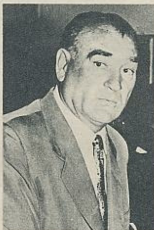
Platko: «Azul heroico y grana» (Alberti).

seta recién arrancada. Y es que no hay duda. Esta es una institución tan importante como pueda serlo el Monasterio de Montserrat, el Omnium Cultural, el Institut d'Estudis Catalans o L'Orfeo Graçenc: