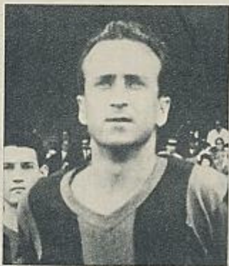
Basora: Un héroe de antaño.