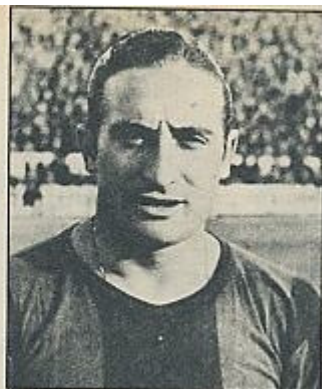
Escold: Una imagen del catalán medio.

Este espectador catalán está muy castigado por la historia. En la supervivencia del Barça se ha consumado uno de los escasos salvamentos del naufragio. Es el Barça la única institución legal que une al hombre de la calle con la Cataluña que pudo haber sido y no fue. Y con ese medium mantiene una relación ambivalente de amor y rechazo, de fanatismo y crítica despiadada, aunque una y otra vez vuelva, domingo tras domingo, al Nou Camp: