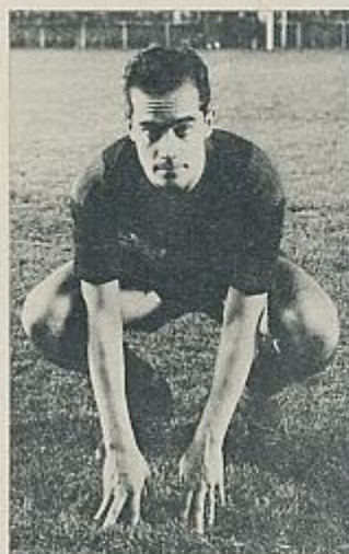
Suárez: Un superclase que no cuajó en el público.

tó imposible recuperar a la mayor parte de jugadores voluntariamente o no exiliados, entre otras cosas por la prohibición oficial de hacerlo. Cuando se levantó la prohibición se recuperó a alguno, el propio Balmanya, pero su carrera deportiva ya estaba casi vencida. El Barça empezaba a proporcionar las escasas alegrías cívicas al alcance del público catalán. El triunfo en las Ligas de 1945, 1946 y 1949 dieron lugar a sendas manifestaciones públicas de barcelonismo, en especial el de 1949, año de las Bodas de Oro del club. Y lo más grande aún estaba por venir. Lo más grande serían las dos temporadas de las Cinco Copas , dirigido al equipo por Dauicik, y dirigido el festival futbolístico por el gran Ladislao. Sobre las evoluciones mágicas del gran Ladislao se concentraba la atención entusiasmada del público del viejo campo de Las Corts, de un público que soportaba «avalanchas», cortes de digestión y tempestades familiares para justificar la laguna de la patria y potestad de un domingo por la tarde. Junto al mito del jugador «de casa», trabajador y honrado como Pujol, el barcelonista también ha cultivado el del exótico jugador extranjero, cuyo extraño perfume de ser de otro mundo parece hipnotizar a las gradas. Platko, el húngaro portero sucesor de Zamora, no sólo había hipnotizado a las gradas, sino al mismísimo Rafael Alberti que, en 1928, escribió un poema sobre él, que lleva la dedicatoria: A José Samitier, capitán: