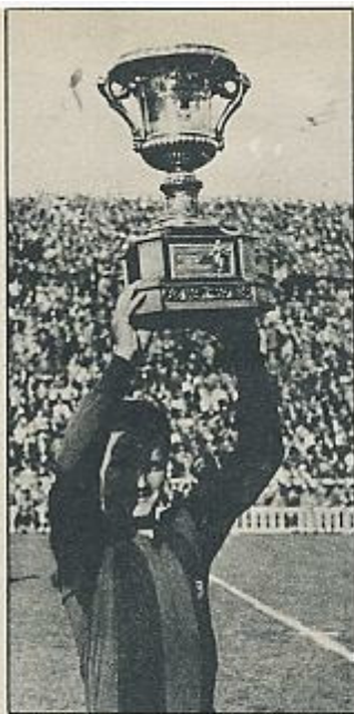
Gonzalvo III: Un hombre de la época de los trofeos.

Y de 1940 a 1942 el público dio una respuesta clara al planteamiento de la cuestión: de 3.000 socios se pasaron a 12.000. Primero resul-