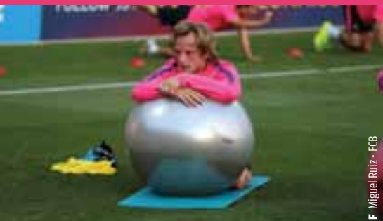
Ivan Rakitic ha ocupado la vacante que deja Cesc en el centro del campo.

El nombre de Rakitic salió pronto porque la posición de Cesc se empezó a mover muy temprano, cuando terminó la temporada. El Club tenía controlados a jugadores que pudieran jugar de '8' y de '10'. “El mercado estaba bastante trabajado, entendiendo que no es fácil jugar en estas posiciones en el Barça porque nosotros les pedimos que jueguen en un espacio corto, reducido, mientras que en los otros equipos tienen algo más de espacio para poder jugar. Les pedimos un juego posicional muy claro. Rakitic era un jugador que habíamos seguido mucho. En el croata encontrábamos lo que buscábamos, y también tiene disparo, llegada, remate, conoce el fútbol español y tiene mucha personalidad”.