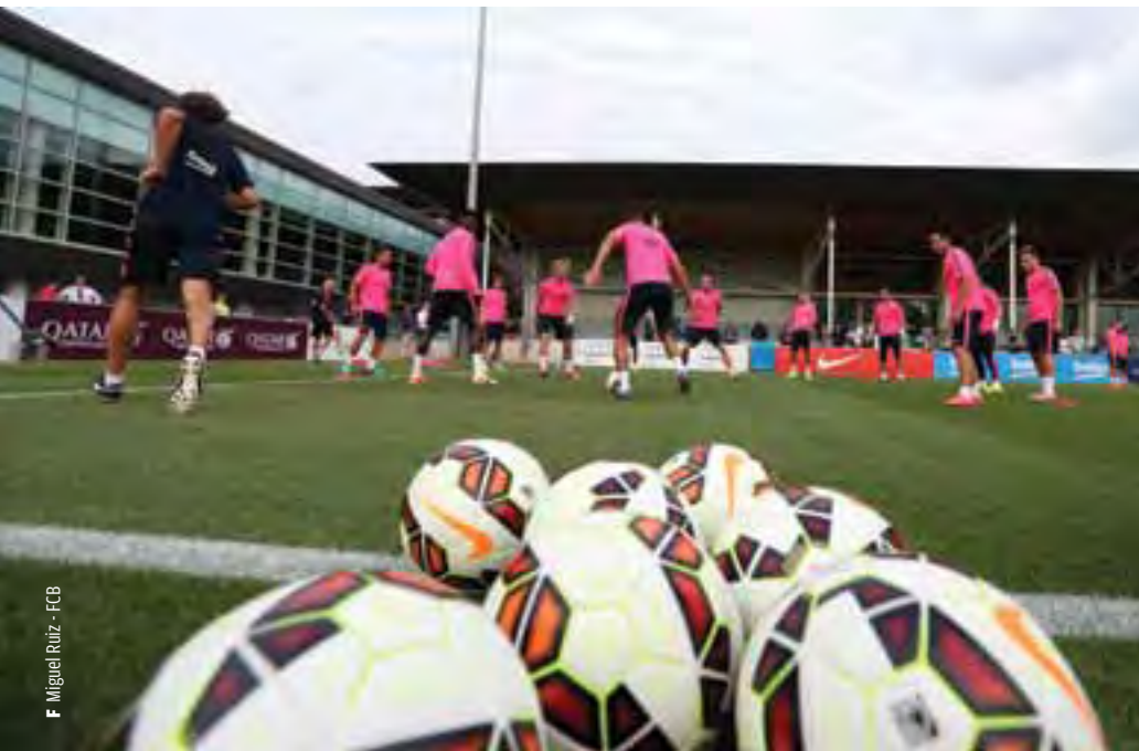
Los jugadores han disfrutado de un excelente clima de trabajo durante la estancia en tierras inglesas.

puedes hacer para retar estas cuestiones. Que haya una discusión táctica respecto al juego del Barcelona que no existe en otros lugares, seguro. Pero esta es una riqueza de nuestro club siempre que no convirtamos las cosas en dogma. Sobre todo porque una de las grandes aportaciones, también de Johan Cruyff en su momento, fue atreverse a retar las cosas propias del dogma y atreverse a moverse, a buscar nuevas opciones y soluciones siempre siendo respetuosos a tu ADN y a tu forma de jugar”.